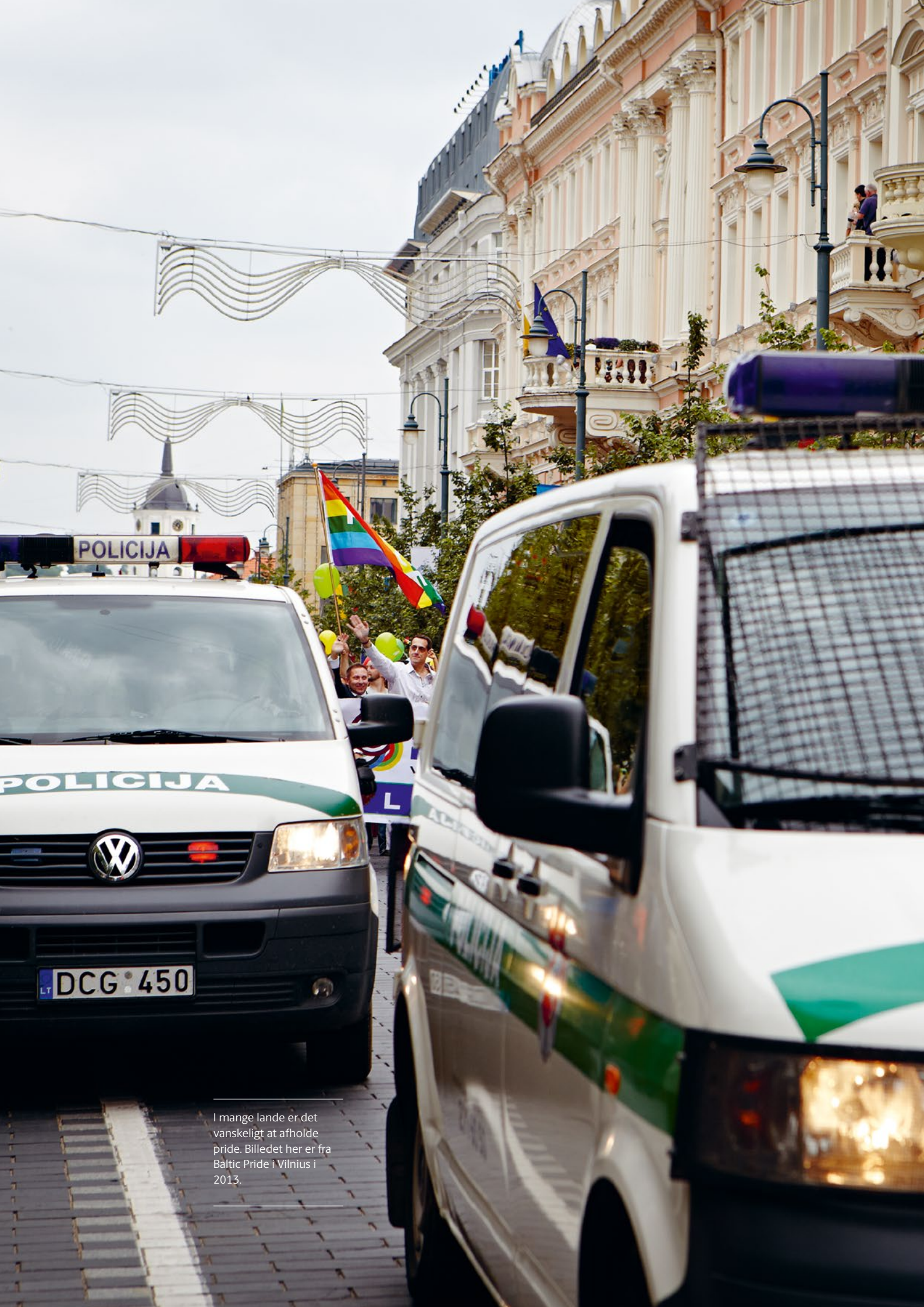
I mange lande er det vanskeligt at afholde pride. Billedet her er fra Baltic Pride i Vilnius i 2013.