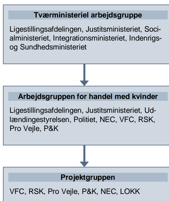
Figur 2: Oversigt over implementeringssystemet

Nedenstående figur giver et overblik over systemet